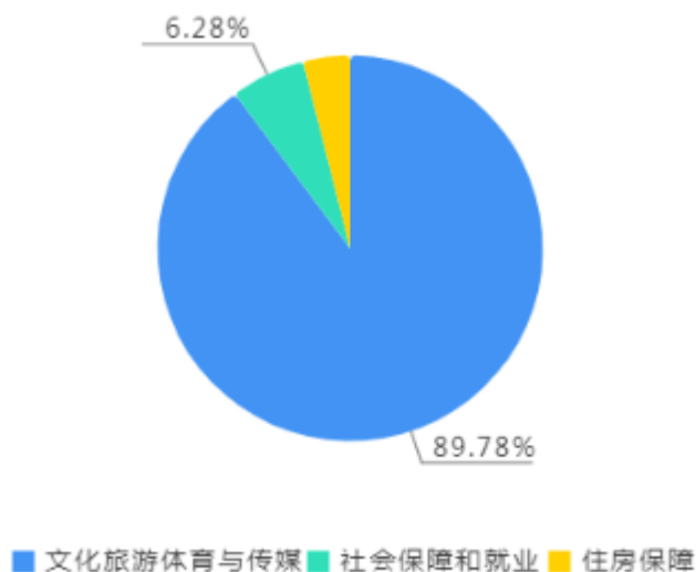
一般公共预算财政拨款支出决算结构图(单位:万元)